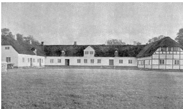
Den gamle hovedbygning - 1923

Fra 1708 til 1781 har gården tilhørt slægten Gleerup, og fra 1810 til 1957 familien Svanholm. I 1957 brændte hovedbygningen. Siden 1959 har Sebber Kloster været ejet af efterkommere af familien Tesdorpf, der i 2006 gennemførte en gennemgribende restaurering af hovedbygningen med det formål at kunne åbne stedet for udlejning til bryllupper, firmaarrangementer eller helt almindelige familiesammenkomster, eventuelt med golfbanerne som trækplaster.