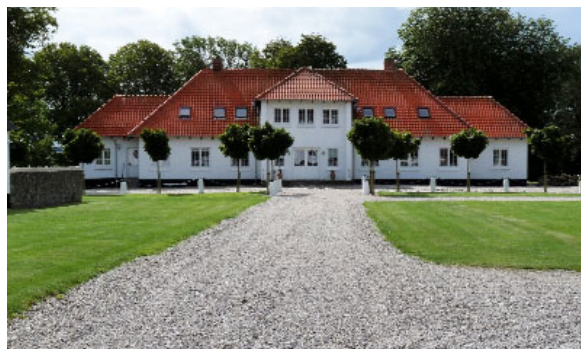
Hovedbygningen i 2010