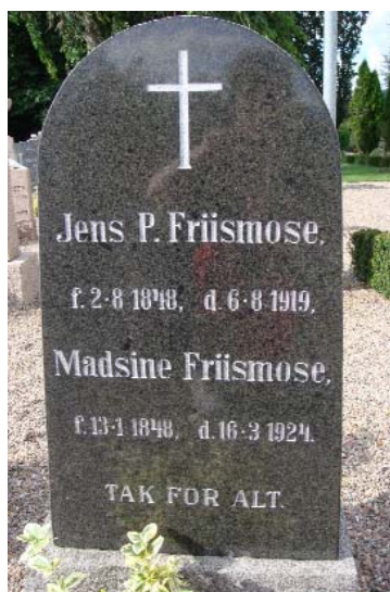
Den fælles gravsten på Albæk kirkegård