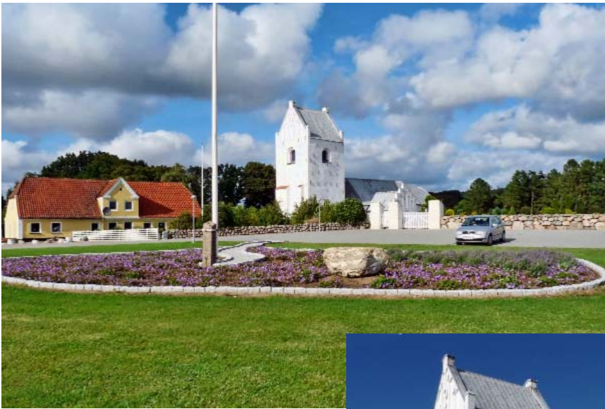
Albæk kirke og præstegård