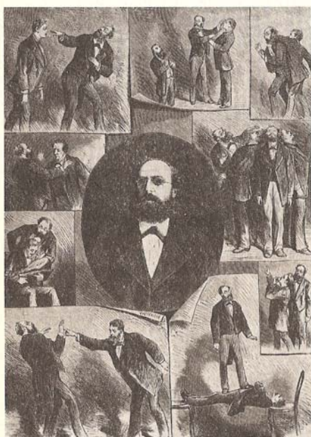
Carl Hansen, omgivet af sine hypnotiske demonstrationer. Reproduktion på grundlag af billedmaterialet i Zöllner, 1879.